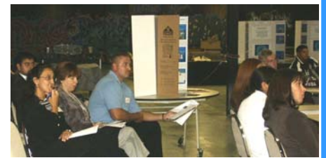
Participantes en la reunion del Sudoeste de Detroit

Nuestro equipo planificador de la intervención: Algunos días después de la reunión en la comunidad, invitamos a un pequeño grupo de miembros de la comunidad y a algunas organizaciones a ser parte del equipo de planificación de intervenciones de la HEP (Intervention Planning Team—IPT). El IPT utilizaría la información obtenida en las investigaciones junto con las ideas compartidos por los miembros de la comunidad para sugerir un plan de actividades que ayuden a mejorar la salud cardiaca en Detroit. Estas actividades serían utilizadas para desarrollar un programa de intervención de salud cardiaca para los residentes de Detroit.